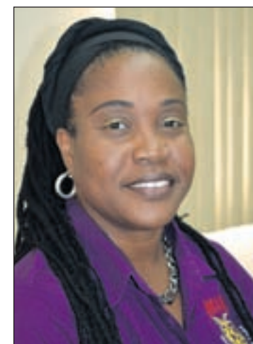
Presidente di directiva di SIMAR

Directiva ta invita abo docente y abo futuro docente (estudiante di IPA) pa asisti